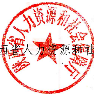
陕西省人力资源和社会保障厅