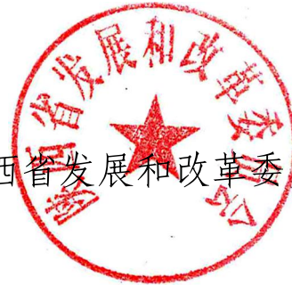
陕西省发展和改革委员会