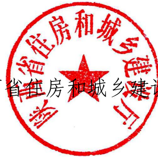
陕西省住房和城乡建设厅