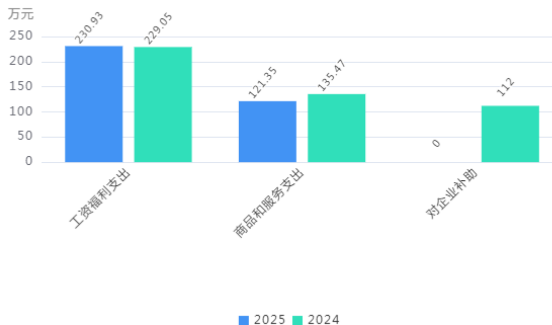
支出按部门预算支出经济分类对比图

2. 按照政府预算支出经济分类，本部门当年一般公共预算支出352.28万元，其中：